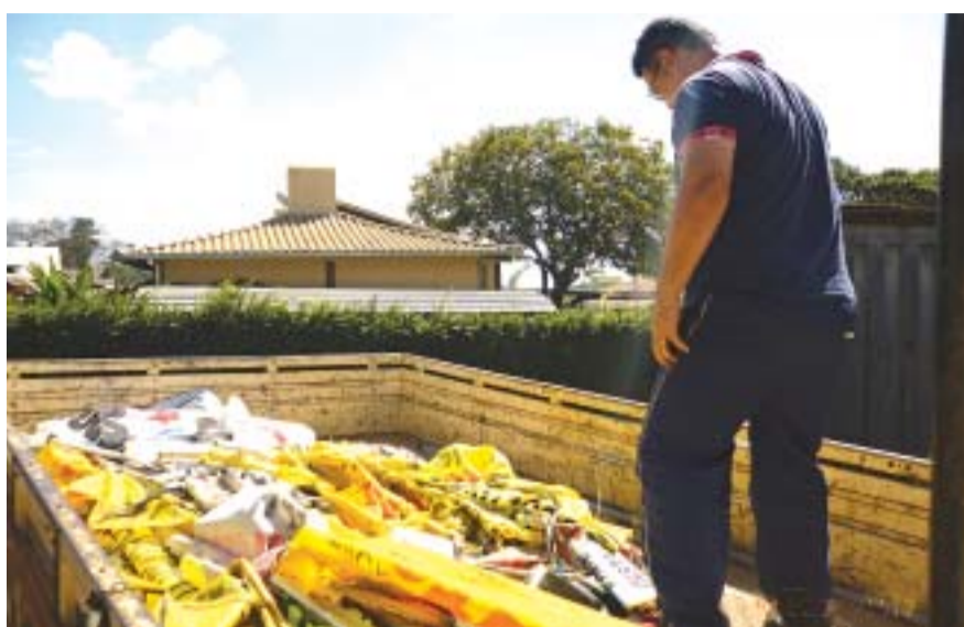
Fiscais recolheram faixas e placas irregulares

estavam em área pública e em local proibido pela legislação, isto é, afixados em muros, postes, árvores, gradis e na sinalização de trânsito e estão depositados na Fiscalização, onde permanecerão por 30 dias. Caso não ocorra procura, serão encaminhados para o descarte adequado. Os responsáveis ou proprietários que tiverem interesse em fazer a retirada dos objetos apreendidos deverão antes pagar os tributos referentes à remoção e à diária pelo depósito.