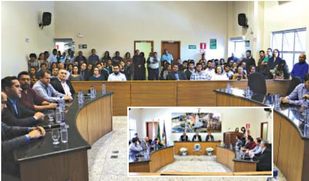
Prefeitos, secretários municipais e membros do CISREC lotaram as dependências da Câmara Municipal de Matozinhos

Constituído em 1995, com o objetivo de cooperação técnica, mútua e financeira entre os municípios e organização do sistema de saúde da microrregião, o CISREC – Consórcio Intermunicipal de Saúde da Região do Calcário, conta atualmente com 12 consorciados sendo: Capim Branco, Confins, Funilândia, Jaboticatubas, Lagoa Santa, Matozinhos, Pedro Leopoldo, Prudente de Moraes, Santana do Riacho, São José da Lapa, Ribeirão das Neves e Vespasiano.