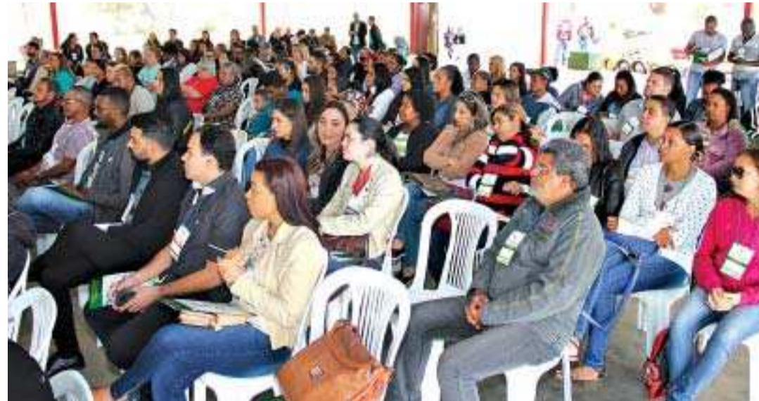
Grande público prestigiou a VIII Conferência de Saúde

Depois das palestras, foi composta a mesa de debates e em seguida a formação dos grupos para a discussão dos eixos. No final da conferência foram eleitos os delegados que vão tomar posse em setembro próximo e representar o município na Conferência Estadual de Saúde.