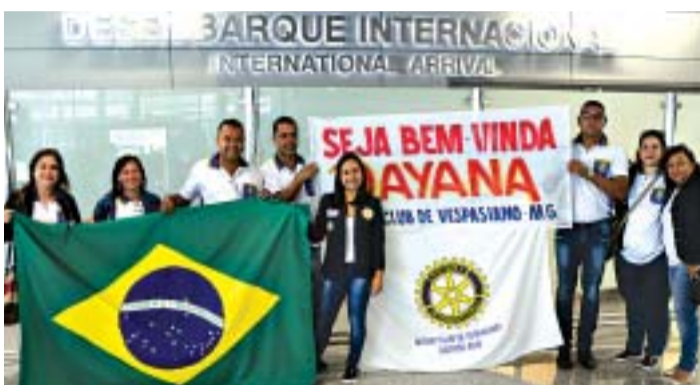
A intercambista foi recebida pelos rotarianos no Aeroporto de Confin