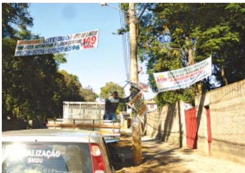
Fiscalização atuou nos termos da Lei na busca de uma cidade mais saudável e com melhor condição de vida

Para informações sobre formas legais de fazer publicidade, entre em contato com a Coordenadoria de Fiscalização: (31) 3688 1487, das 8 às 18h.