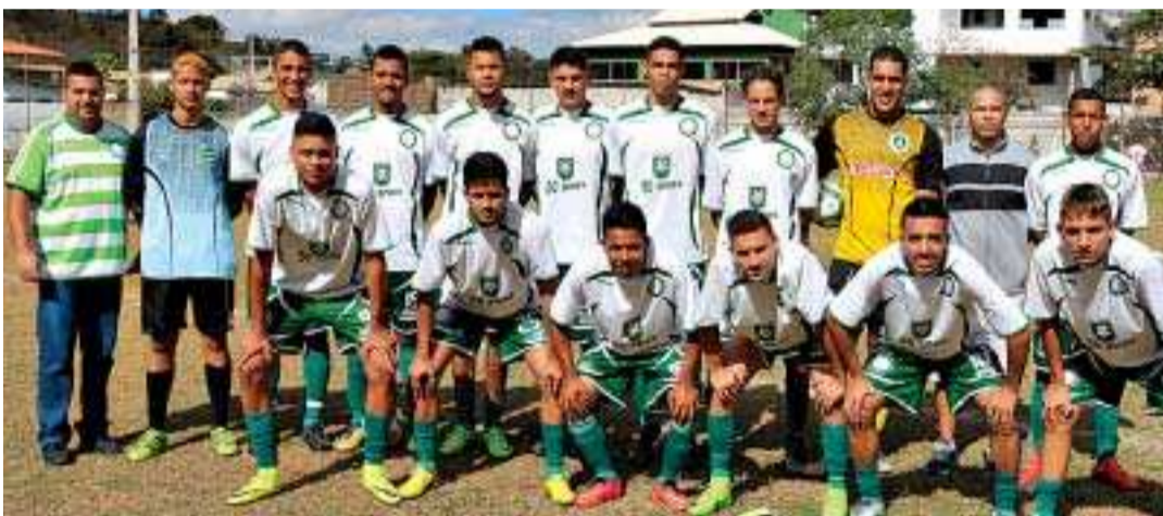
Alface venceu o Paissandu por 1 x 0 e vai disputar a final contra o Cruzeiroirinho

No próximo domingo, dia 06, Cruzeiroirinho e Alface disputam a primeira partida das finais. O primeiro jogo será no Estádio Darcy Isaías, no Morro Alto. No domingo seguinte, dia 13, acontece a partida decisiva no Estádio Gato Mano, do Alface, em Vespasiano quando sairá o campeão de 2017.