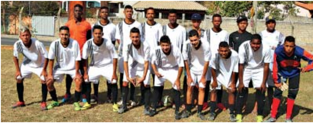
Cruzeirinho se classificou vencendo o Grêmio M. Alto por 1 x 0

Após a rodada do último dia 30, domingo, foram conhecidos os finalistas do campeonato de juniores de 2017, promovido pela Liga Municipal de Desportos de Vespasiano.