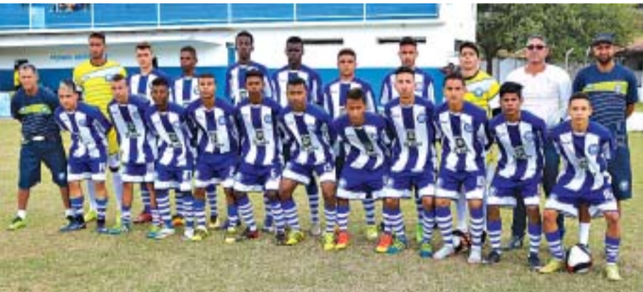
O Vespasiano enfrenta o Grêmio M. Alto na final do Juvenil