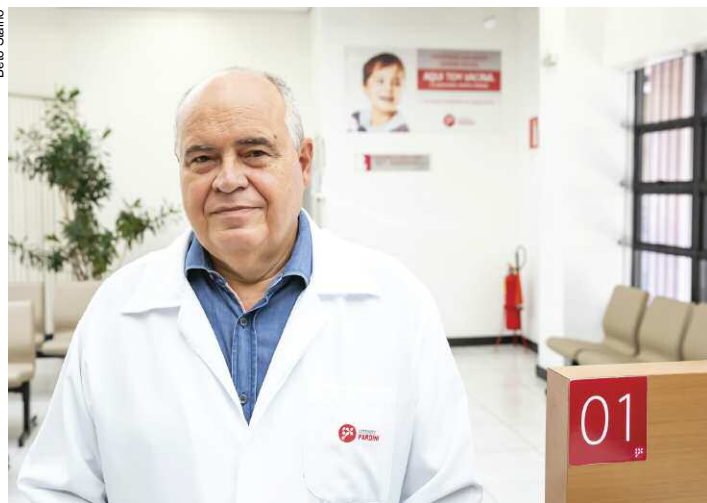
Epidemiologista reforça a importância da nova vacina contra a Herpes Zoster que chegou ao Brasil neste ano

O ano de 2022 marca uma nova era na prevenção do Herpes Zoster, uma infecção viral provocada pelo vírus Varicela-Zoster, o mesmo da Catapora. É que finalmente chegou nos serviços privados brasileiros, uma vacina inativada, recombinante, depois de anos de uso no Hemisfério Norte. Até então, no Brasil, tínhamos como possibilidade de prevenção com uma vacina viva, a Zostavax. Mas o que a nova vacina contra Herpes Zoster traz de novidade? A Shingrix é uma vacina recombinante contra o Herpes Zoster. Foi a primeira a ser testada em imunossuprimidos, já que sua composição apresenta apenas pedaços do vírus. Por não ter o vírus vivo, amplia a possibilidade de uso em relação à anterior.