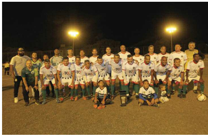
A equipe do Alface, Campeã do Torneio João Araújo

Para deixar a final ainda mais emocionante, o campeonato foi decidido na cobrança de penalidades e a equipe do