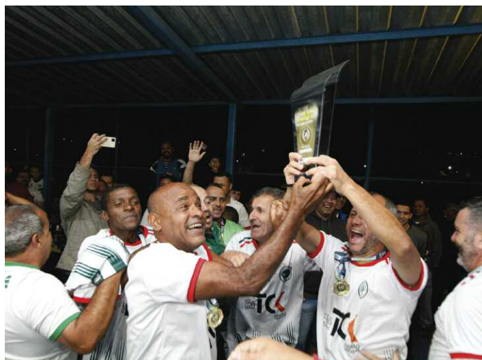
A galera do Alface comemorou muito levantando o Troféu João Araújo