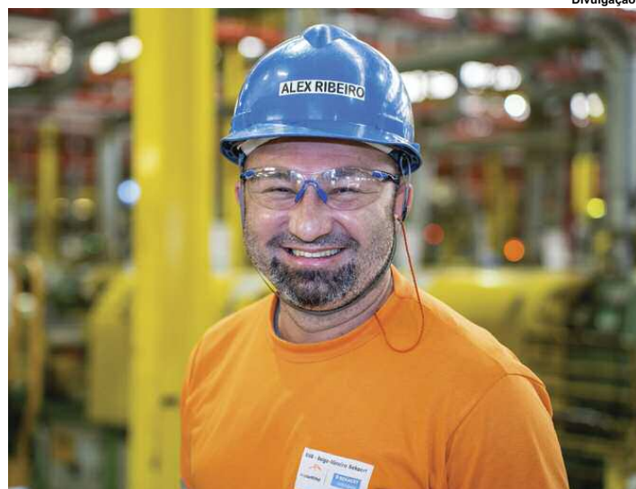
Belgo Bekaert é novamente eleita como uma das 30 melhores empresas de grande porte para trabalhar no Brasil

tar a cultura de inovação, a empresa está ofertando capacitação em Design Thinking, elaborada em parceria com a consultoria internacional Design Thinking Group (DTG), e a Jornada Empreenda Belgo, realizada com a aceleradora de negócios inovadores Troposlab, para 160 empregados.