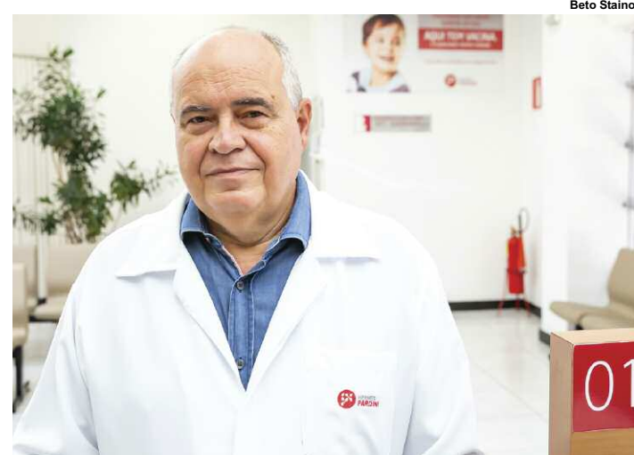
Epidemiologista reforça a importância da nova vacina contra a HPV

As infecções pelo HPV são relacionadas a uma série de complicações que podem afetar muito a saúde e qualidade de vida do paciente. A prevenção eficiente con-