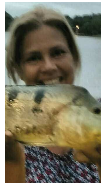
D. Kênia também fígou um belo tucunaré com isca artificial indicação do Kioshi