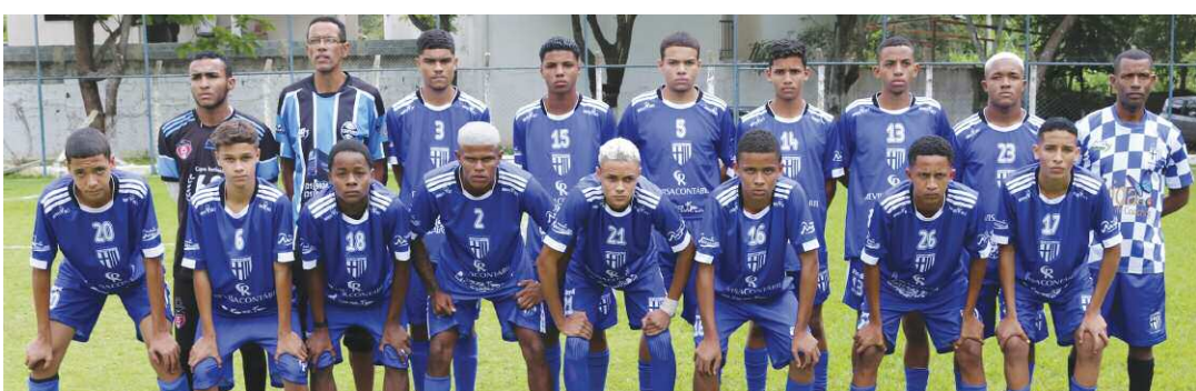
Grêmio Morro Alto é o vice-campeão da categoria