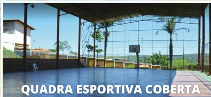
QUADRA ESPORTIVA COBERTA