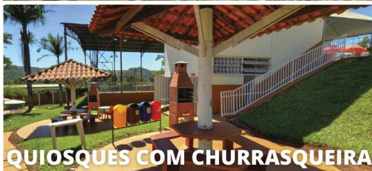
QUIOSQUES COM CHURRASQUEIRA