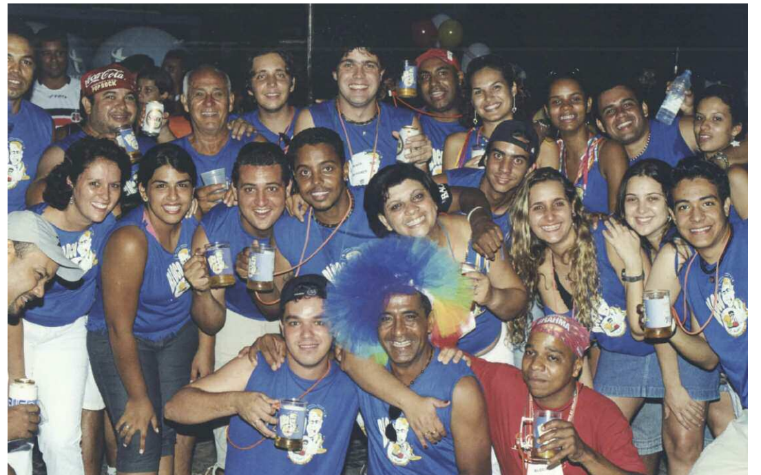
foto do bloco carnavalesco Os Piores, do ano de 2006, portanto, há 17 anos. Veja a turma que era super animada.

É muito bom recordar. É muito bom encontrar uma foto de um grande momento há tempos vivido. Acima, a