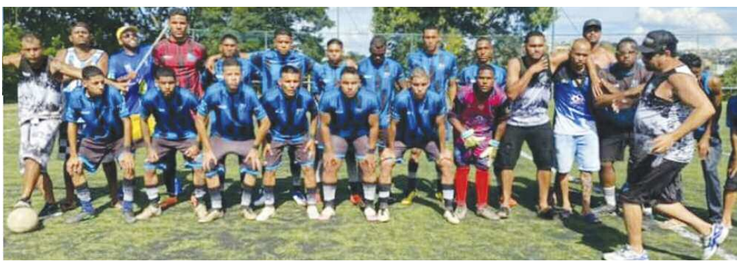
Real Juventude, categoria Sub-20 conquistou o título de campeão de 2022

Durante a partida disputada na Arena Imperial, em Cipriano, entre o Real Juventude e Águia Dourada, o primeiro sagrou-se campeão amador da Categoria Sub-20 ao derrotar o segundo na cobrança de penalidades pelo placar de 5 a 3. No tempo normal, Real Juventude e Águia Dourada empataram por 2 a 2.