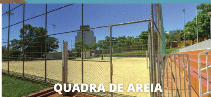
QUADRA DE AREIA