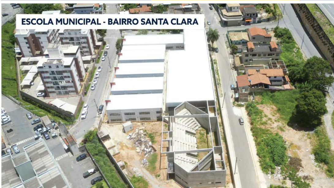
ESCOLA MUNICIPAL - BAIRRO SANTA CLARA

*5x com vencimentos em 10 de maio, 9 de junho, 10 de julho, 10 de agosto e 11 de setembro de 2023