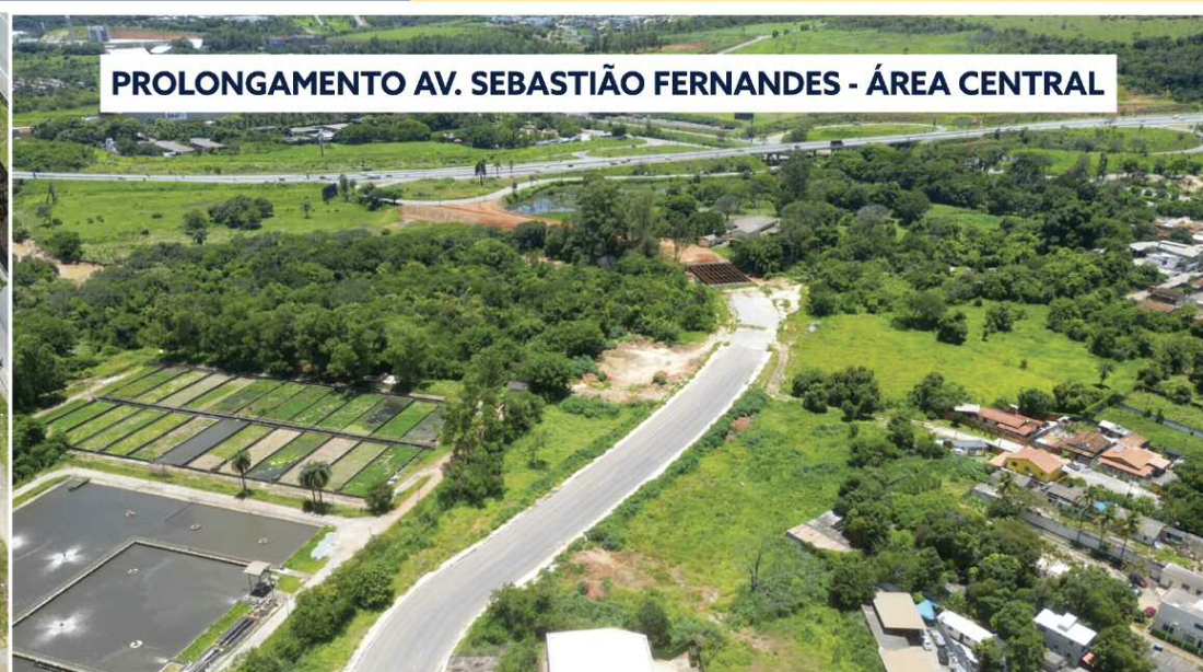
PROLONGAMENTO AV. SEBASTIÃO FERNANDES - ÁREA CENTRAL

RETIRE A 2ª VIA DA GUIA DE IPTU NO SITE DA PREFEITURA ACOMPANHE AS REDES SOCIAIS