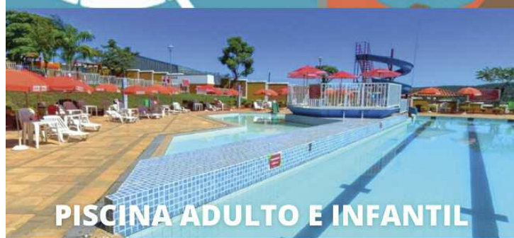
PISCINA ADULTO E INFANTIL

piscina semiolímpica, quadra esportiva coberta, piscina adulto e infantil, playground, saunas, quadra de areia e muito mais