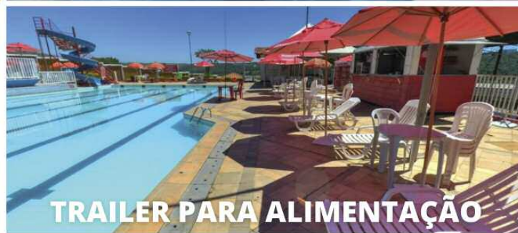
TRAILER PARA ALIMENTAÇÃO

Familiar: R$ 45,00 (dependentes legais) Familiar c/ um agregado: R$ 55,00 (dependentes legais, agregado sem comprovação de vínculo) Individual c/ um agregado: R$ 45,00 (sem comprovação de vínculo); Individual: R$ 36,00.