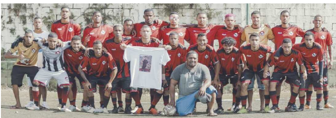
Águia Dourada, categoria Sub-20 é vice-campeão da temporada