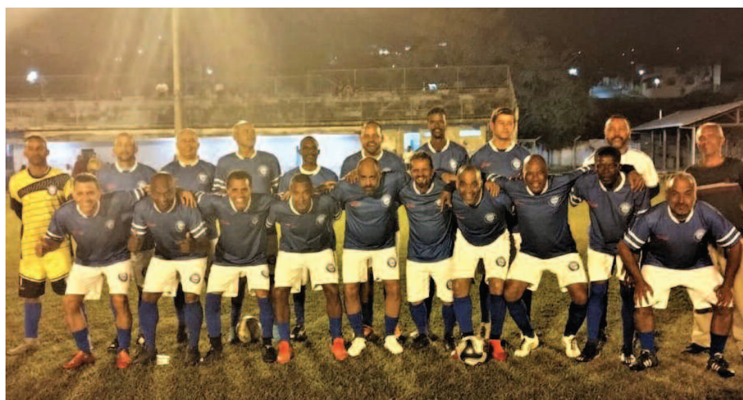
Vespasiano - 1º colocado no Grupo B