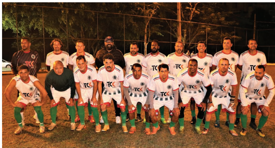
Alface - 1º colocado no Grupo A

A decisão da Taça Master, será no dia 16 de julho, domingo, às 9h30, no Estádio Gato Mano, do Alface indicando quem leva o Troféu Zé Rocha.