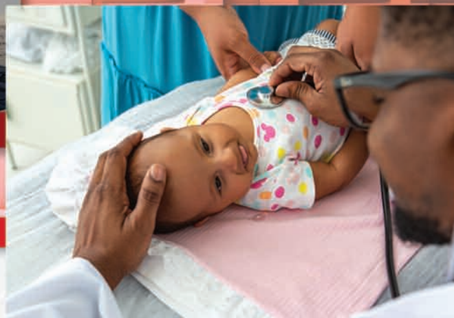
Ampliação de Hospital da Santa Casa.

Os deputados estaduais trabalham por todos os mineiros. Eles escutam as pessoas para conhecer as realidades do estado e levam resultados reais para todo canto de Minas.