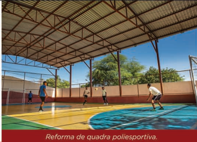
Reforma de quadra poliesportiva.