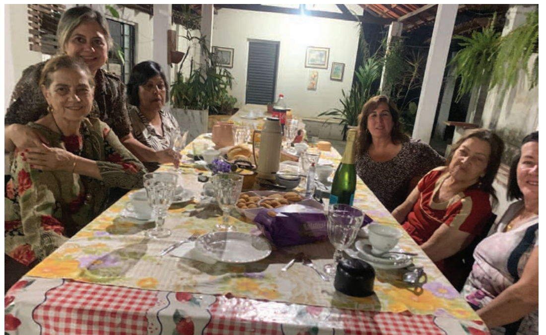
Reunião de Companheiras do Lions, analisando um planejamento de leitura a ser desenvolvido por Clubes de Lions

A posse da nova Diretoria está prevista para o início de agosto e a ela desejamos pleno êxito em suas ações!