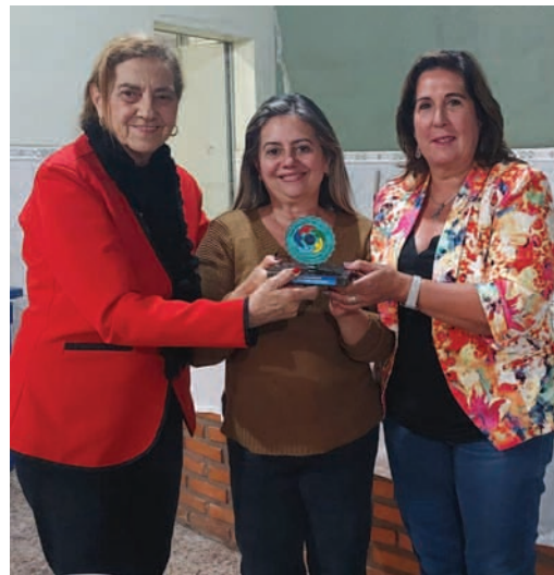
Presidente e Vice-presidente do Lions Clube de Vespasiano recebendo troféu por ter dado uma assessoria num dos eventos da Convenção Distrital ocorrido em abril de 2023 em Águas de Lindóia