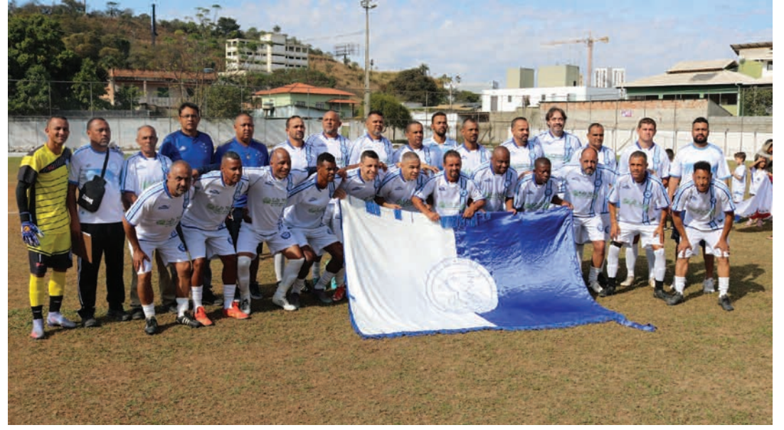
Vespasiano E. C. Vice-campeão

Durante os meses de junho e julho, a Secretaria de Juventude e Esportes, realizou a Copa Master 45+ Troféu Zé Rocha, em diversos campos de futebol da cidade. Nesta edição oito times disputaram o torneio: Alface, Águia Dourada, Bela Vista, Grêmio, Nova York, Red Bull, Santa Clara e Vespasiano.