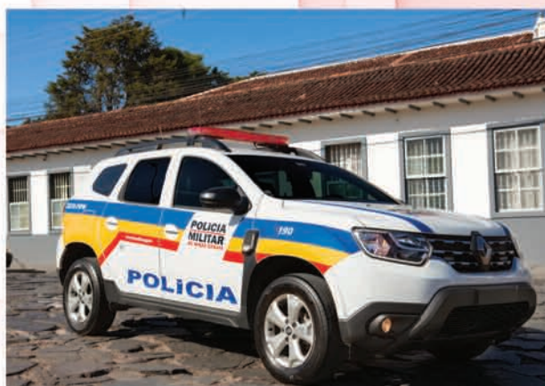
Entrega de viaturas para a Polícia Militar.