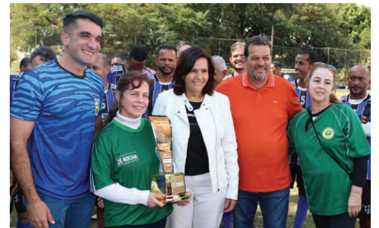
Família Rocha - se fez presente e foi homenageada