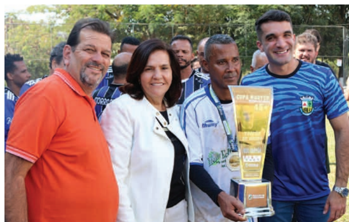
O capitão do Vespasiano recebeu o troféu de vice-campeão