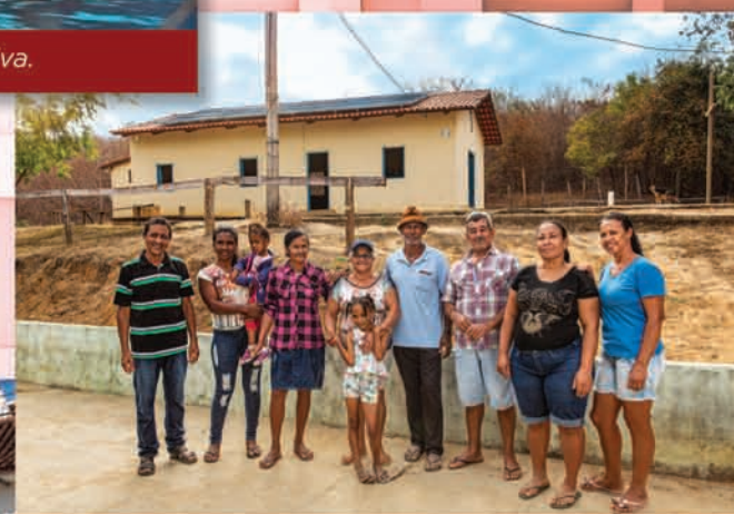
Equipamento de energia solar para comunidades.