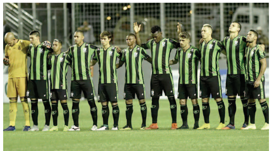
Tombense, Vila Nova e América lideram suas chaves até a 4ª rodada