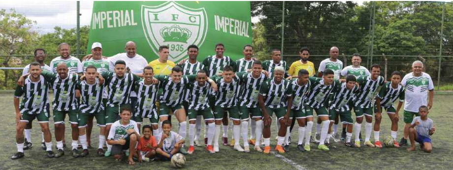
O Imperial foi o campeão de 2024 e é forte candidato neste ano. 17 equipes participam do certame

O certame tem início no dia 31 de agosto quando cerca de 500 atletas amadores estarão presentes. Veja ao lado, a tabela dos jogos para 2025.