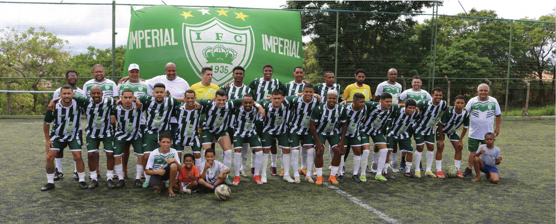
Imperial - Campeão amador de 2024 e está em 1º lugar na chave C deste ano