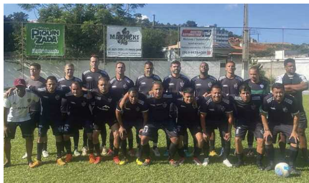
Amigos do Alface