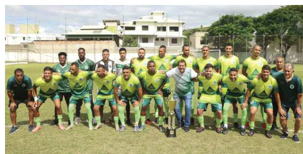
A.A. Alface equipe Amadora