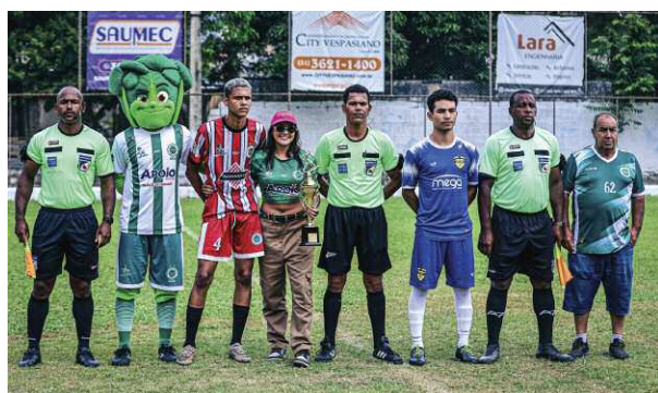
Juizes e Capitães das 2 equipes