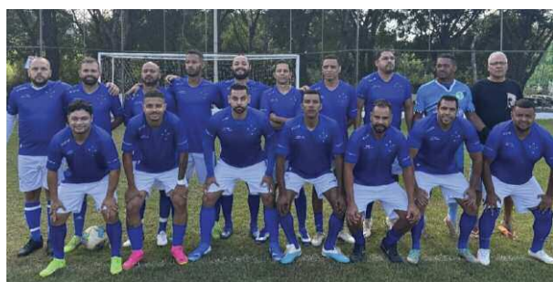
Cruzeiro E. Clube (Alface)