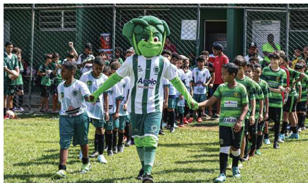
Equipe da base do Sub-10