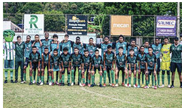
Base do Alface Sub-17

Comemorando o seu 63º aniversário, a Associação Atlética Alface promoveu um ótimo festival nos dias 1º, 03 e 04 de maio no Estádio Gato Mano.