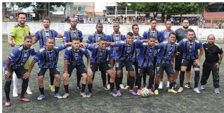
Real Juventude é vice-campeão 2024