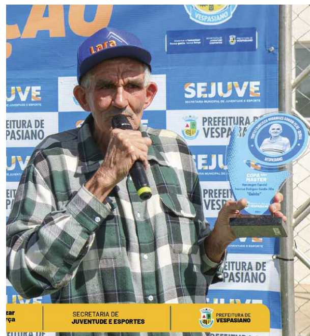
Quinha teve o nome perpetuado no Esporte Amador de Vespasiano