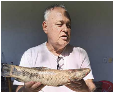
Véio físgou a traíra