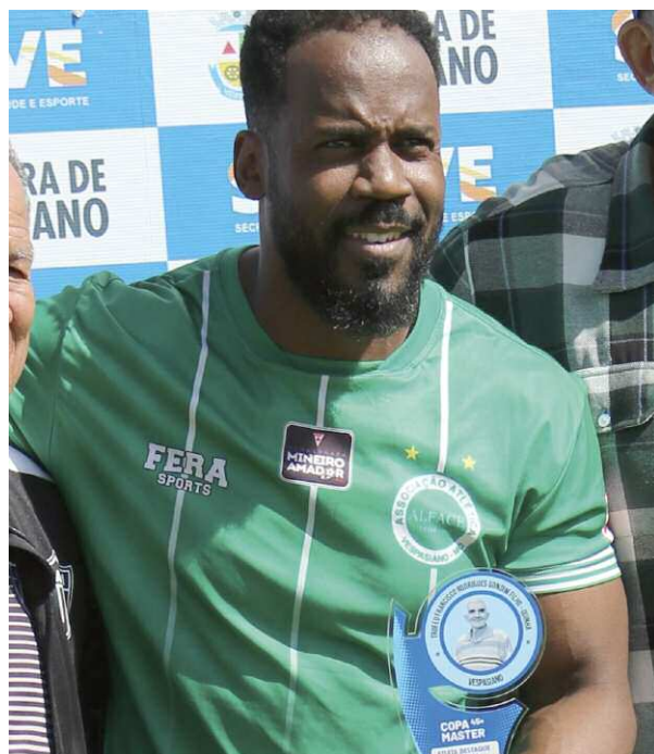
Pelé- artilheiro do torneio