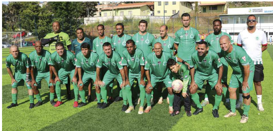
Alface Campeão da Copa Master 45+ de 2025