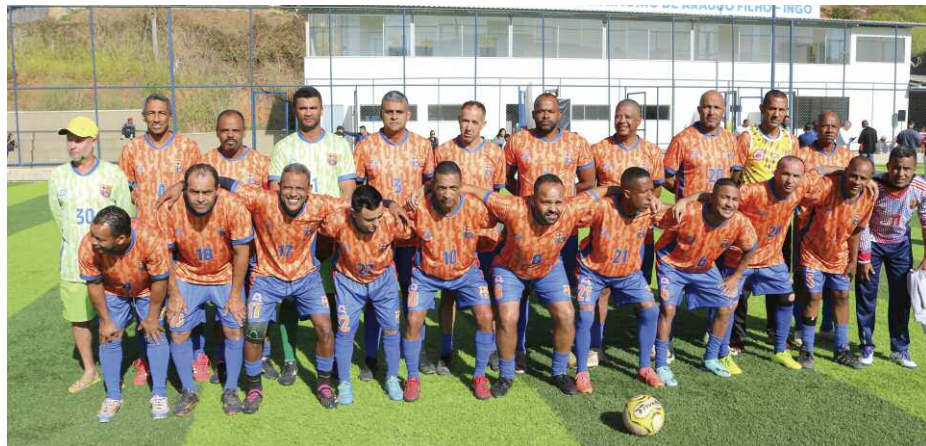
Nova York, Vice Campeão do Torneio Copa Master 45+

Aconteceu no dia 15 de junho a decisão da Copa Master 45+, disputada no Estádio Manoel Antônio de Araújo Filho, o Sr. Ingó, no bairro Célvia. Alface e Nova York fizeram uma grande e bem disputada partida com lances espetaculares e muitas chances de gols para as duas equipes.